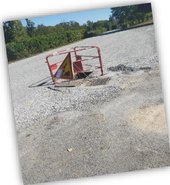
Reprofilage de la partie basse du parking du Mille Club