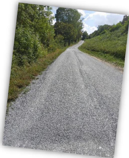
Rehaussement d'une portion de la route de Sarrau

Des travaux ont été réalisés par la SARL BORDAT pour un montant total de 9 341 €.