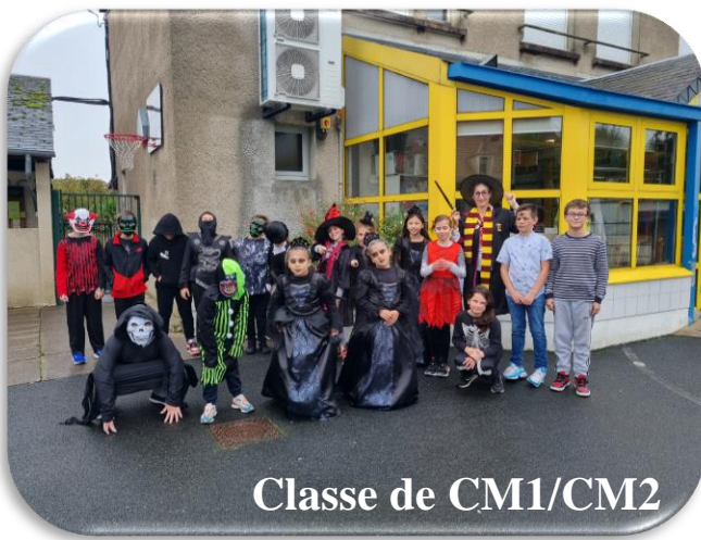
Classe de CM1/CM2

Ce même jour, la classe de CM1/CM2 a élu ses nouveaux délégués.