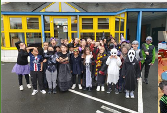
Classe de CP/CE1/CE2

Loups-garous, sorcières, squelettes, petits monstres et fantômes se sont invités le vendredi 18 Octobre à l'école. L'occasion de fêter tous ensemble Halloween et de terminer de manière plus festive la première période scolaire avant les vacances de Toussaint.